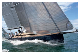
CODE 1 BLACK PEPPER

Schicker und schlanker Daysailer aus Italien. Das Boot und das komplette Rigg sind im Standard aus Kohlefaser gebaut