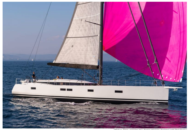
CNB 66 R - Riem - September 2017 - American Algortare / Ramslary